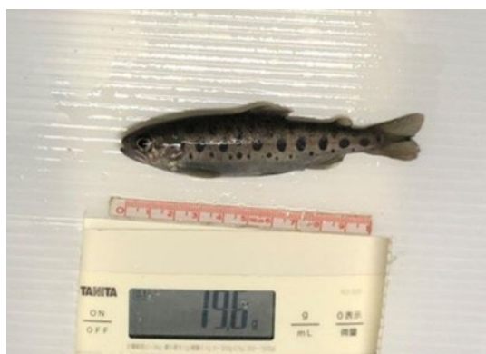
図 2 : 代謝測定で使用したサクラマス幼魚